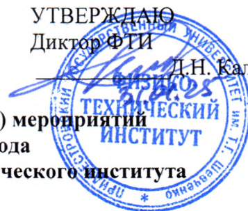
График проведения текущих контрольных (модульных) мероприятий на 2 полугодие 2024-2025 учебного года инженерно-технического факультета физико-технического института